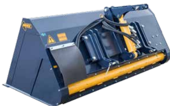
SS04 med trepunktsfäste monterat