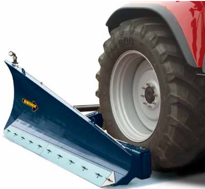
Sidovinge för traktor