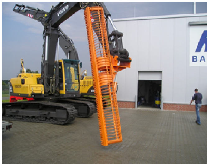
Med hydraulisk sving