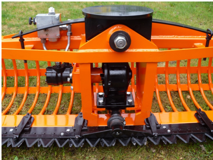
Med centralt smørested og tryk- og mængdedeler

Løkkeby Strandvej 10 • DK-5900 Rudkøbing • Tlf. +45 62 56 1667 Fax +45 62 56 16 07 • CVR/SE-nr. 31481945 • www.special-maskiner.com