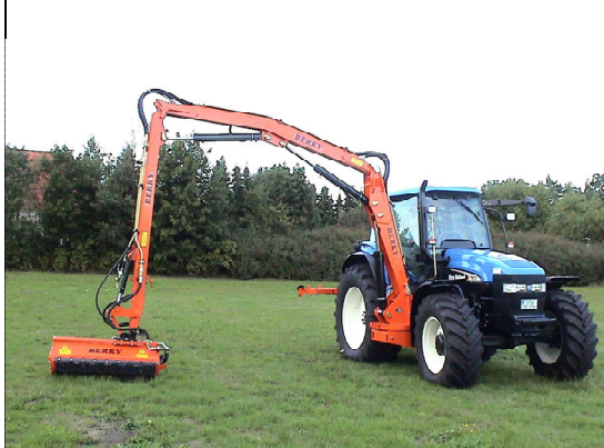
- 3 delt armklipper