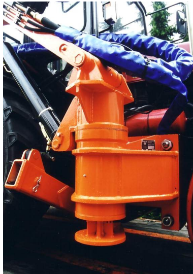
- Sving via cylinder eller planetgear.