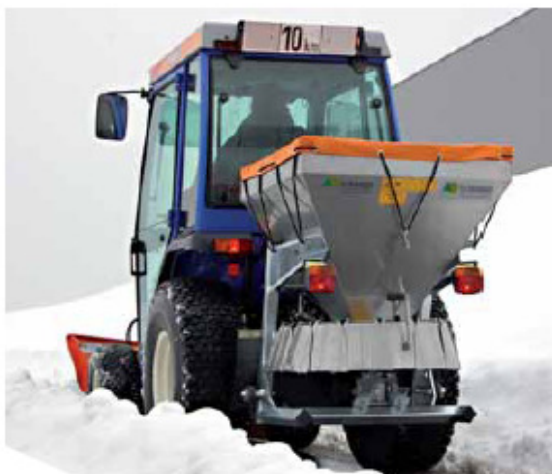
Tallerkenspreder XTA-250 på traktor