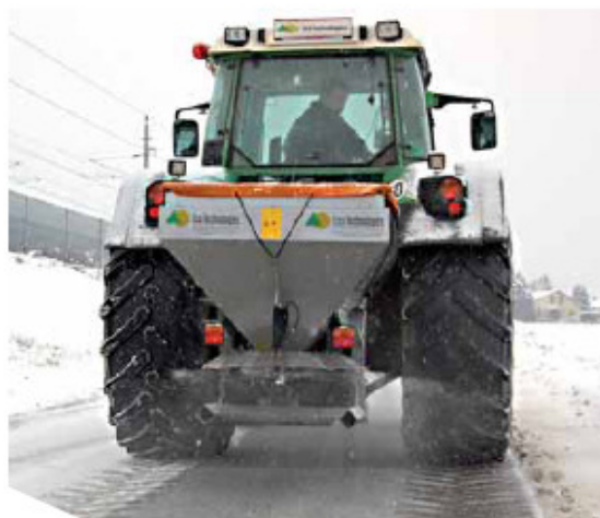
Tallerkenspreder XTA-750 spredning på veje